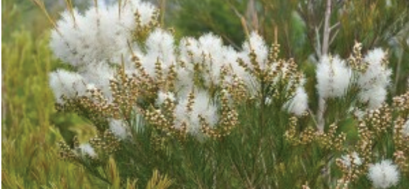
Óleo de Melaleuca

A Melaleuca é uma árvore de origem australiana que a partir da destilação das suas folhas é possível extrair um óleo conhecido mundialmente pelas suas propriedades benéficas.