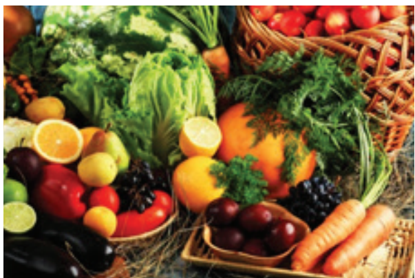
Fontes de oligoelementos