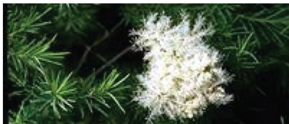
Ciclodextrinas de Melaleuca

A Melaleuca é uma árvore originária da Austrália e a partir das suas folhas é possível extrair um óleo conhecido mundialmente pelas suas propriedades, dentre elas a ação antisséptica e cicatrizante.